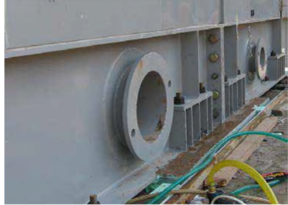
Şekil 1. Grout dökümünden önce türbin temelinin ankraj deliklerinde suya doyurma ve fazla suyu tahliye etme işlemleri

Beton yüzeyde donmuş kısımlar, kütleme amaçlı kullanılan membranlar, su yalıtımı uygulamaları, yağ lekeleri, kaymak tabakası ve toz iyice temizlenmelidir. Beton yüzeyler pürüzlendirilerek hazırlanmalı ve eğer su sızıntısı varsa tahliye edilmeli veya uygun bir şekilde tıkanmalıdır. Grout dökümünden 24 saat önce döküm yapılacak alan suya doyurulmalıdır. Yüzeyler nemli olmalı fakat yüzeyde fazladan serbest su kalmamalıdır. Özellikle civata deliklerine dikkat edilmeli ve bu deliklerin su içermediğine emin olunmalıdır. Gerektiğinde deliklere ve boşluklara basınçlı hava uygulayınız. Taban plakaları, civatalar, vb. yağ, gres ve boya gibi maddelerden arındırılmalı ve temiz olmalıdır. Ekipman yerleştirilmeli ve konumu ayarlanmalıdır. Ayar takozları (şimler) grout priz aldıktan sonra çıkartılacak ise, groutun yapışmaması için hafifçe yağlanmalıdır.