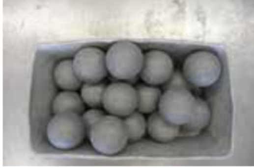
Şekil 2. Darbe için kullanılan çelik toplar