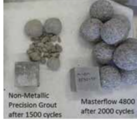
Şekil 3. 1500 ve 2000 çevrim sonrasında grout numuneleri.